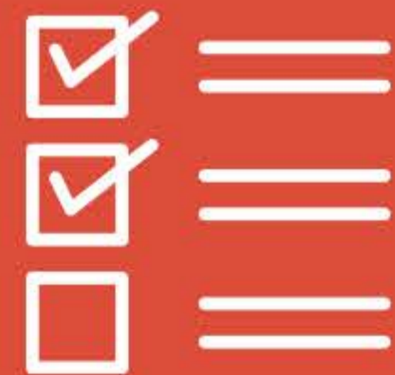
Historial de cambios