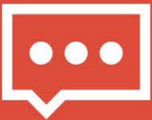
Notificación por comentarios