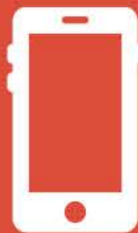
Edición desde múltiples dispositivos