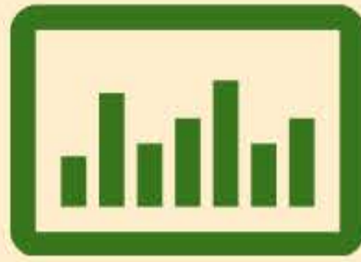
Hojas de Cálculo